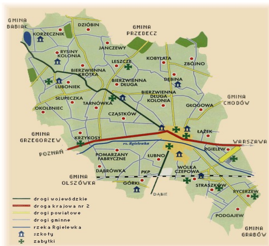
Rysunek 2.1. Położenie miejscowości Bierzwienna Długa

Wieś Bierzwienna Długa jest położona we wschodnio-południowej Wielkopolsce, w gminie Kłodawa, województwie wielkopolskim. Rozlokowana jest wzdłuż drogi wojewódzkiej nr 263, biegnącej od Kłodawy przez Bugaj do Babiaka i Sompolna. Jadąc od Kłodawy trasą wojewódzką nr 263 w kierunku Babiaka, na wysokości około 5 km rozpoczyna się centrum wsi, zapoczątkowane po prawej stronie zabytkowym parkiem wiejskim o powierzchni 5,36 ha. Południowe obrzeża parku biegną na długości około 300 m wzdłuż pobocza wymienionej trasy nr 263. Na kończących się południowych obrzeżach parku znajduje się skrzyżowanie dróg powiatowych: Bierzwienna – Przedecz, Bierzwienna - Cząstków z trasą wojewódzką 263. Skręcając w lewo, w kierunku południowym, przez miejscowość Cząstków, w odległości 4 km dojeżdżamy do trasy A 2.